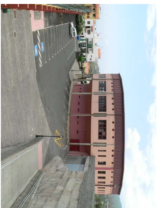
RECINTO DE LUCHA CUBIERTO