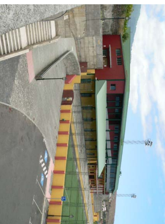
PABELLÓN POLIDEPORATIVO CUBIERTO