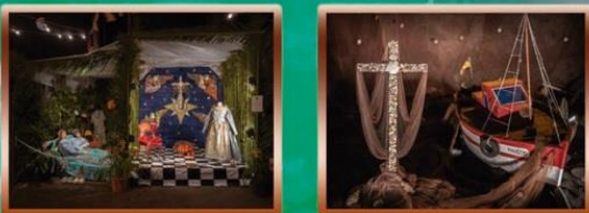
Cruz de Los Chicos Cruz de La Caldereta