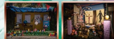
Cruz CEIP Manuel Galvan Cruz CEIP Miranda