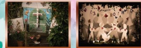
Cruz Chica Cruz CEIP Botazo