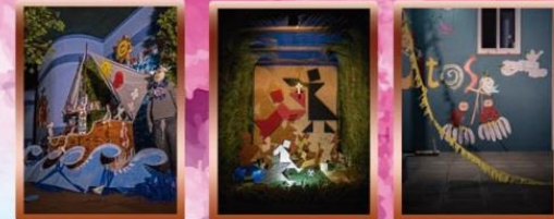
Cruz CEIP Buenavista Cruz CEIP Breña Cruz Centro Infantil