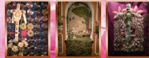
Cruz de La Sociedad Cruz de La Laja del Barranco Cruz del Lomo de Llanito