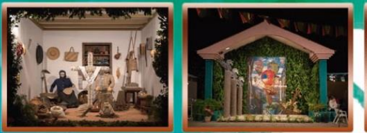
Cruz del Manchón Cruz del Morro Cruz de La Calafata