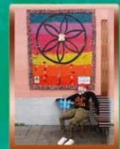
Cruz de Embarrate (Mojo de Caña)