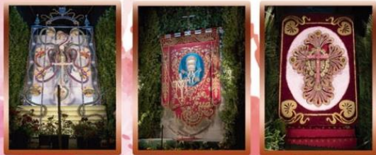
Cruz Chica Cruz del Centro Cruz Lomo Llanito