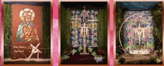
Cruz de Los Bolos Cruz de La Pasión Cruz de La Sociedad