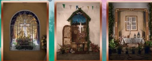
Cruz de Las Animas Cruz de Los Álamos Cruz de Miranda