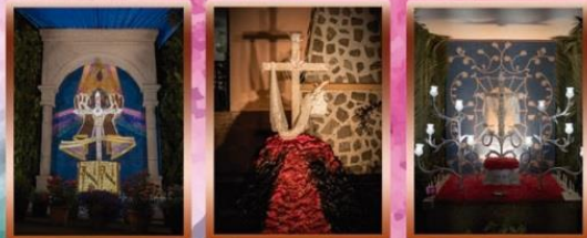
Cruz del Medio Cruz Camino de Los Brezcos Cruz Centro de Acogida